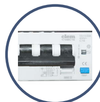
QUADRO con magnetotermico differenziale

Distribuito in esclusiva da: Prai s.r.l. Gravina in Puglia (BA)/Italy, 70024, via Nobel, 15/17 tel.: +39 080 325 58 17